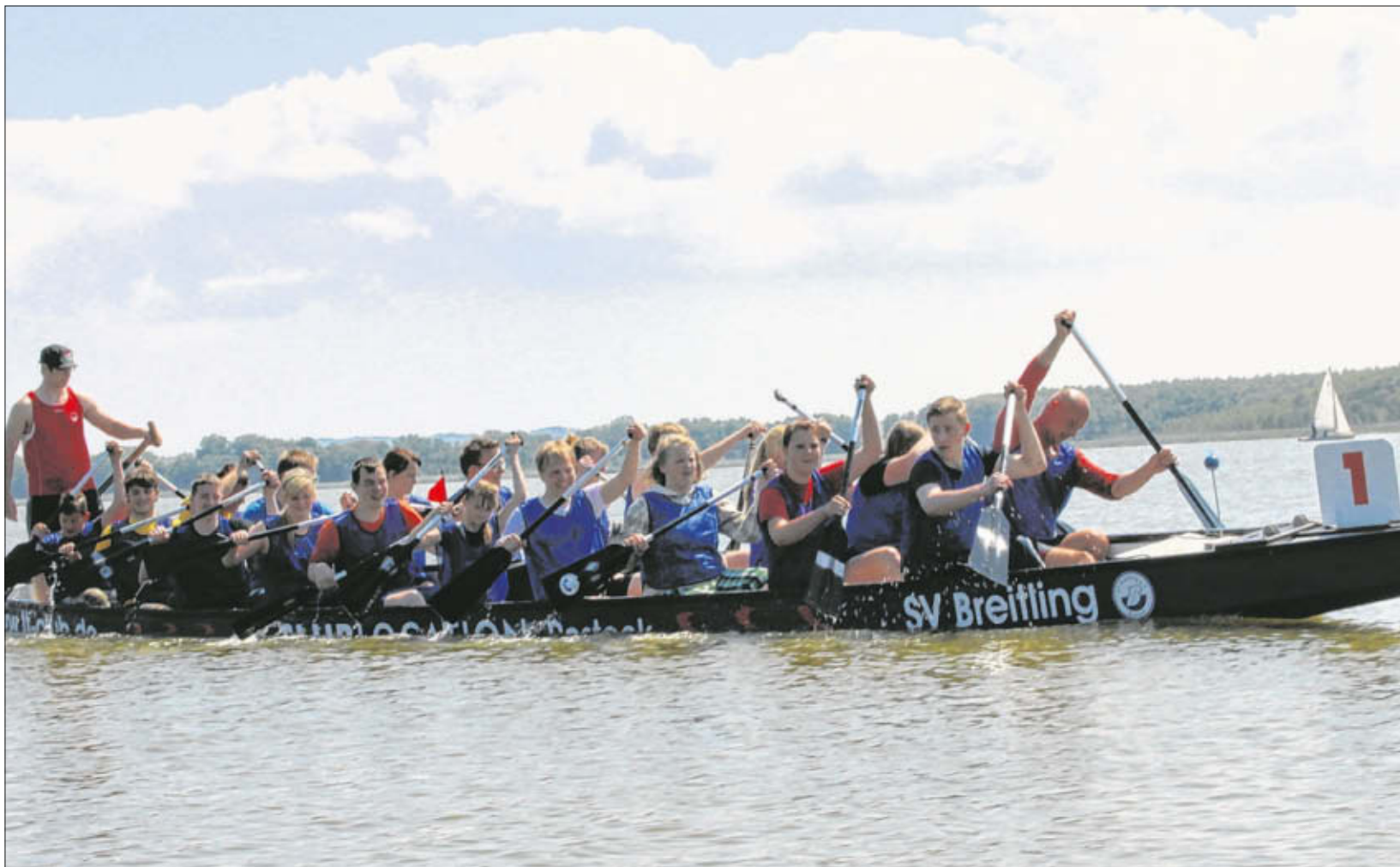
Die Mädchen und Jungen der Regionalen Schule „Am grünen Berg“ gaben als „Blaue Tomaten“ alles. Doch am Ende reichte es nur für den vorletzten 13. Platz.